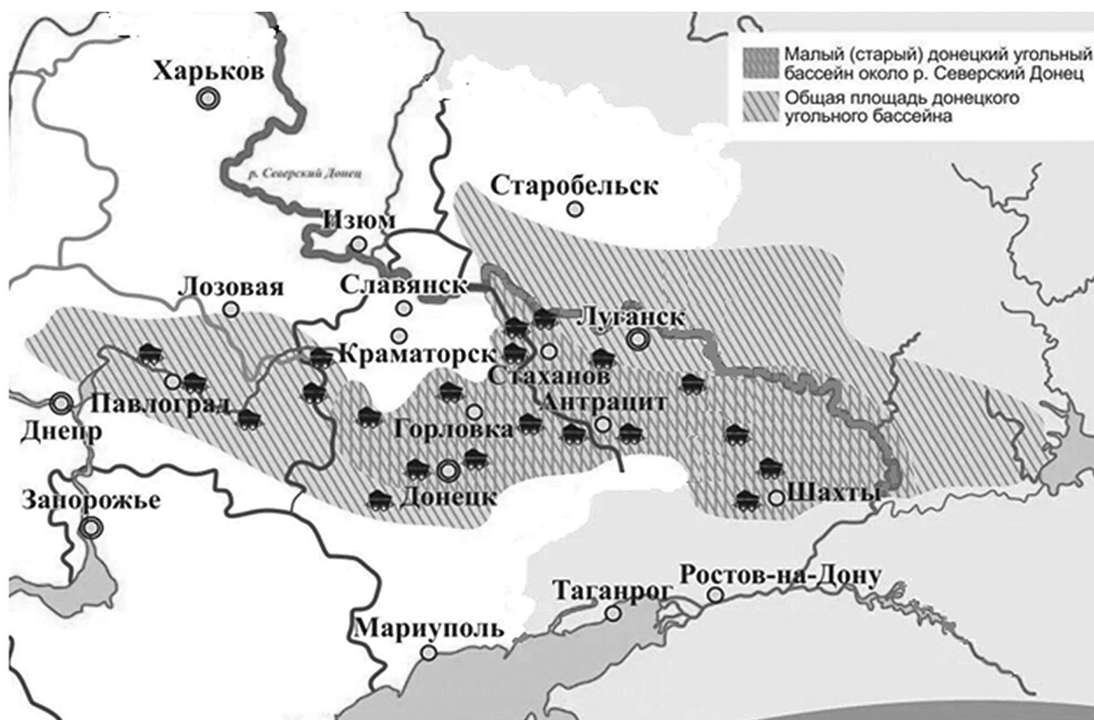
Рис. 1. Донецкий угольный бассейн

По данным Государственного комитета по экологической политике и природным ресурсам при Главе Донецкой Народной Республики, в настоящее время насчитывается более 500 ед. породных отвалов, из которых 430 недействующие, 83 горящие и всего 54 рекультивированы. При этом их внешнее состояние изменяется со временем, они переходят от темно-серого цвета к рыжему, что объясняется протеканием процессов горения и окисления. В среднем их высота достигает 100 м при занимаемой площади зачастую