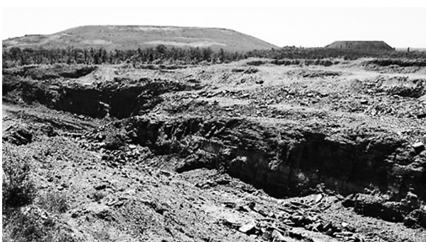
Рис. 2. Породные углеотвалы шахты Аютинская, Ростовская обл.

Из-за токсичности этих веществ на загрязненных территориях наблюдается деградация растительного покрова, а выживаемость растений-фиторемедиаторов крайне низкая (рис. 2). Вследствие этого земли, нарушенные угледобычей, невозможно использовать в рамках целевого назначения.