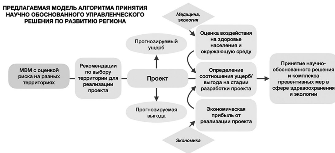
Рис. 7. Модель алгоритма научного обоснования управленческого решения в сфере планируемой хозяйственной деятельности с целью превентивной оценки риска для окружающей среды и здоровья населения, основанная на данных медико-экологического мониторинга