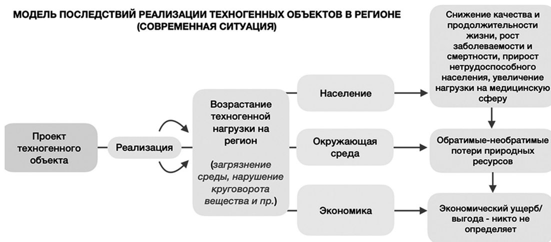
Рис. 6. Существующая тактика хозяйственной деятельности в регионе и ее последствия для окружающей среды и здоровья

Изложенные выше попытки выстраивания определенной логики научно-практических исследований показали их целесообразность и результативность. Но проблема заключается в том, что такого рода задачи требуют ресурсов и координации на