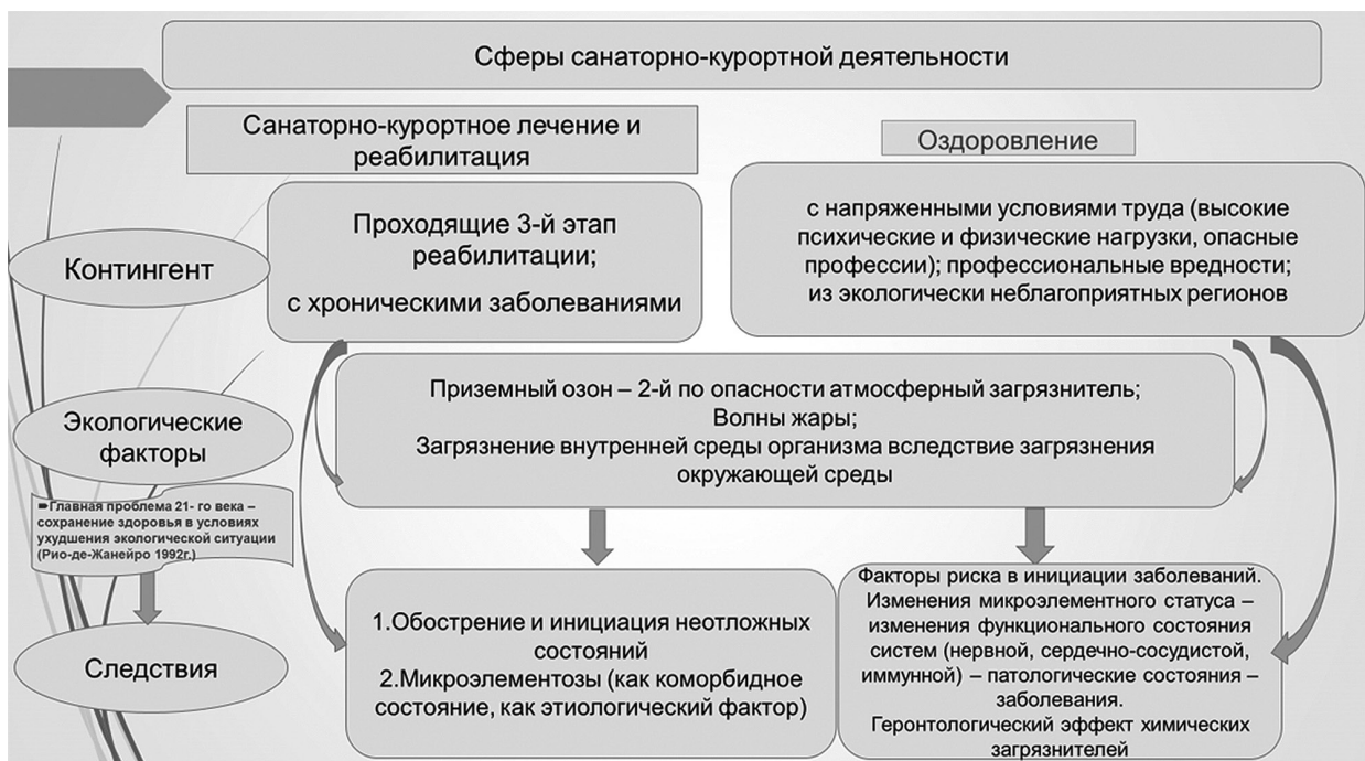
Рис. 5. Актуальные аспекты санаторно-курортной отрасли в современных экологических условиях

Учитывая то, что Крыму присущи общие для любой территории экологические проблемы, а также его пространственную ограниченность и важную геополитическую роль, оценка риска здесь должна быть представлена как ни в каком другом регионе Российской Федерации. И именно ограниченность в географическом отношении территории создавала уникальную возможность отработки механизма экологизации развития региона, которую можно было бы