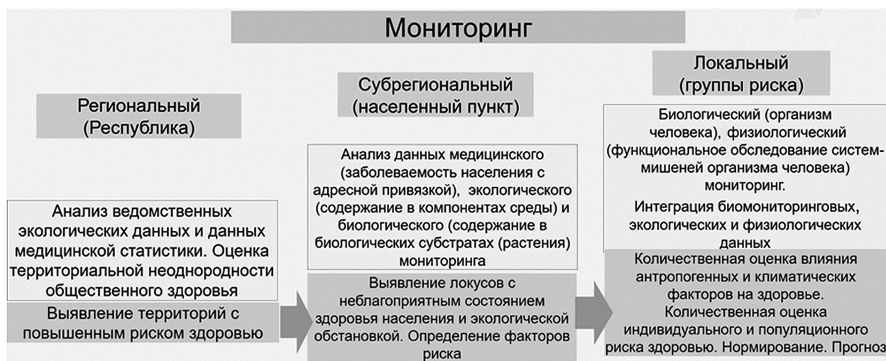
Рис. 1. Схема мониторинговых исследований по оценке экологического риска здоровью

Эколого-биофизиологический мониторинг — это следующий логический шаг в идентификации риска наиболее значимых на данной территории для здоровья человека поллютантов, которые были выявлены в результате предыдущих видов мониторинговых исследований. Совместный анализ биомониторинговых данных и параметров функционального (физиологического) обследования когорты населения (групп риска) позволит количественно оценить степень риска для