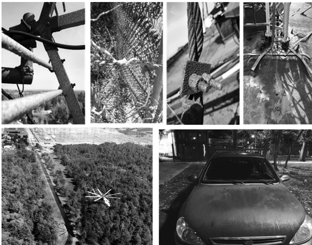
Рис. 4. Повреждения объектов окружающей среды на территориях, пострадавших в результате выбросов из кислотонакопителя