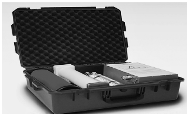
Рис. 3. Походный разрушитель электроники под названием 2100 Series Suitcase на основе генератора Маркса, производимый компанией Applied Physical Electronics

• возрастанием уязвимости самой микропроцессорной техники к внешним электромагнитным воздействиям вследствие постоянного увеличения плотности микроэлементов в объеме кристалла, уменьшения изоляционных слоев в кристалле, снижения рабочих напряжений (со стандартных 5 до 1,5 В в некоторых новых микросхемах), увеличения производительности и рабочей частоты микропроцессоров, расширения применения внутренней памяти в микросхемах различного назначения, перехода от магнитных накопителей информации к флэш-памяти и т.д.;