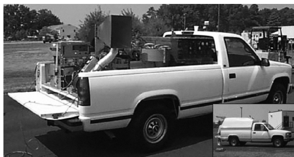
Рис. 2. Источник направленного сверхвысоко-частотного излучения, смонтированный в пикапе на базе легковушки с пластмассовым кузовом